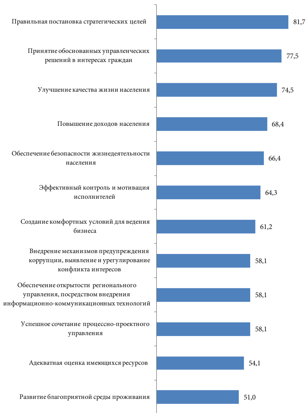
Рис. 1. Распределение ответов на вопрос о том, в чём может выразиться результативная деятельность управленческих кадров региональных органов власти

характеристиках, как: правильная постановка стратегических целей (4,3 балла), принятие обоснованных управленческих решений в интересах граждан (4,2), улучшение качества жизни населения (4,1) (см. рис. 1).