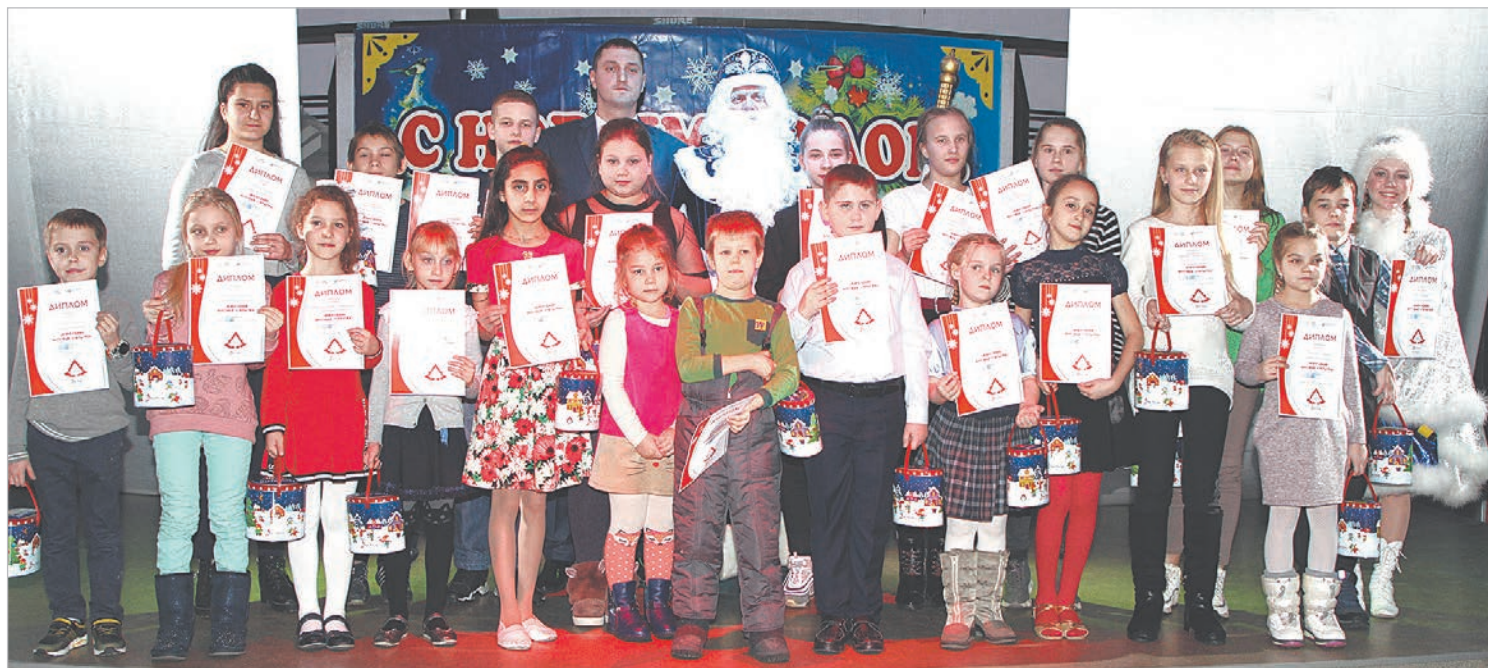
Участники конкурса «Новогодняя почтовая открытка» представили 130 работ.