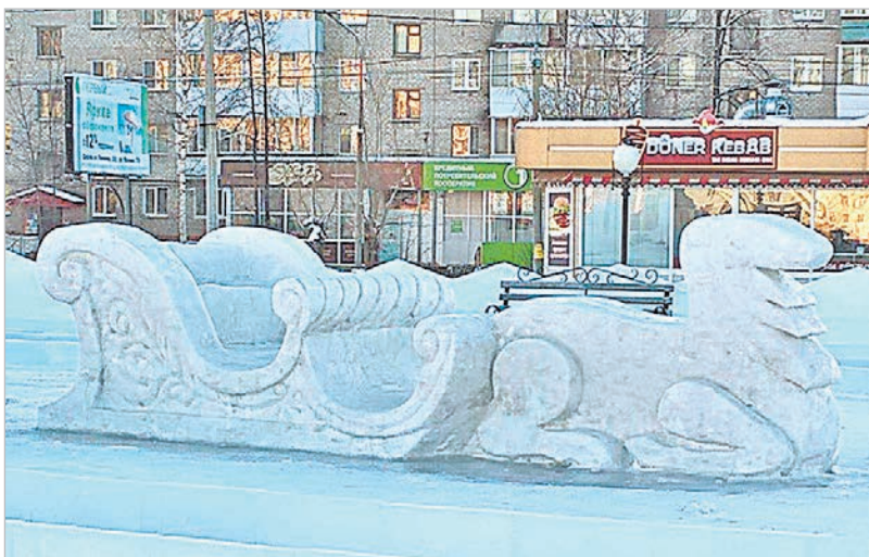
Осмотреть Центральный зимний городок серовчане смогут с 25 декабря.