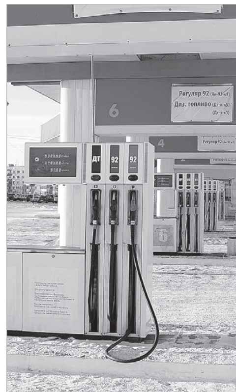
Снимок Светланы Гладковой