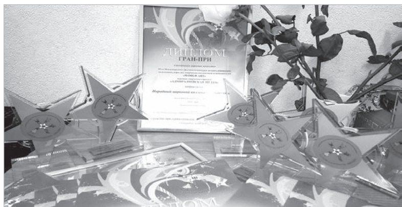
Народный цирковой коллектив «Кассиопея» Дворца культуры металлургов удостоен Гран-при конкурса «Адмиралтейская звезда».

Два коллектива Дворца культуры металлургов успешно выступили на престижных конкурсах. Поддержку им оказывает Надеждинский металлургический завод.