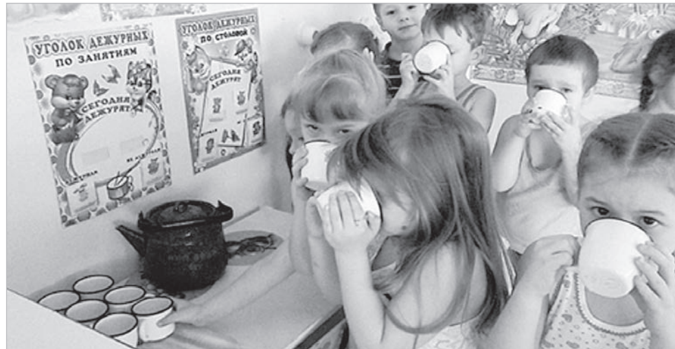
Витаминные комплексы и пектиновые кислоты получили за два года 400 серовских дошколят.