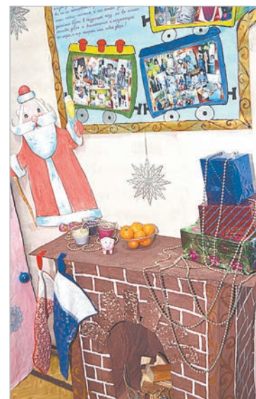
Новогодний камин в ЦАЛ.