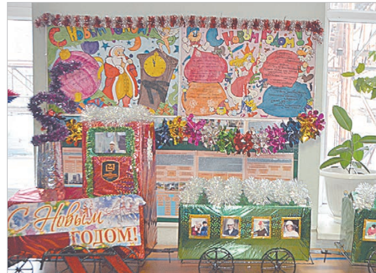
Цех подготовки производства «посадил» в новогодний экспресс своих

Цех общественного питания, недавно вернувшийся в состав завода, впервые участвовал в предновогоднем конкурсе, убранство столовой пока довольно скромное, но тут главное – качество еды, а не елки. А то, что металлургов кор-