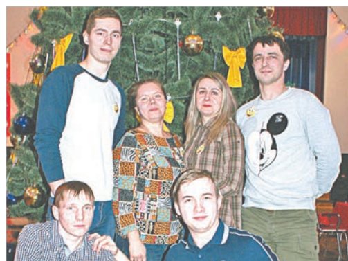
«Оптимисты» – команда «Серов-СПАС».