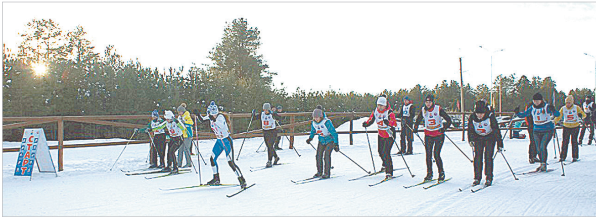
Старт эстафеты на первенстве Надеждинского металлургического завода по лыжным гонкам.

■ Зимний сезон 2018-2019 годов на Надеждинском металлургическом заводе открылся в прошедшую субботу, 22 декабря, первенством предприятия по лыжным гонкам. Всего на старт вышли 48 заводчан.