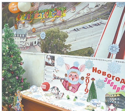
Новогодняя газета в ОТК.