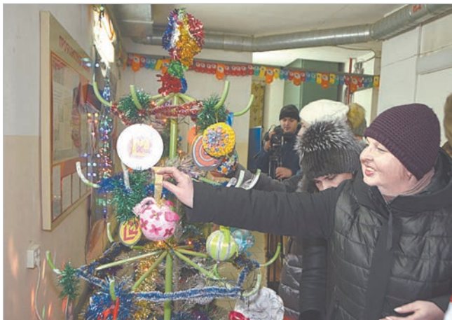
Необычная елка-трансформер в цехе КИП и автоматики.