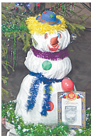
Снеговик в калибровочном цехе.