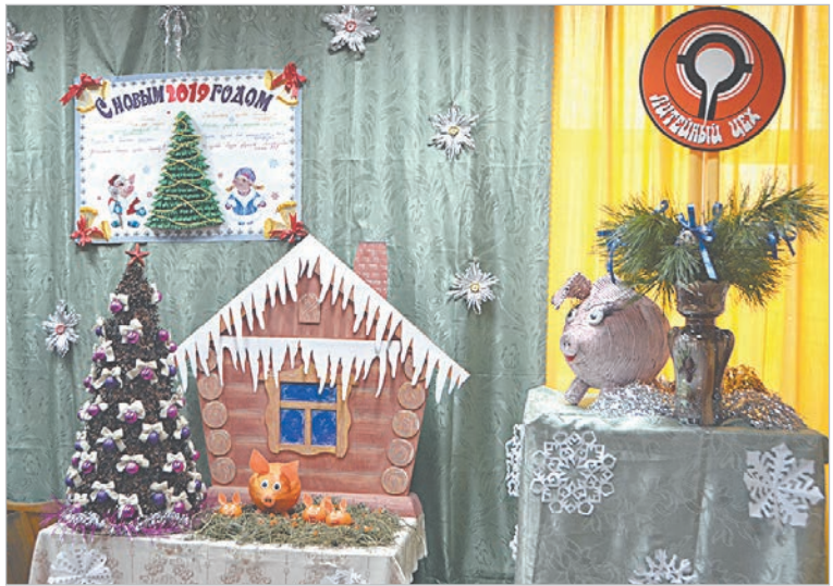
Праздничная атмосфера в литейном цехе.