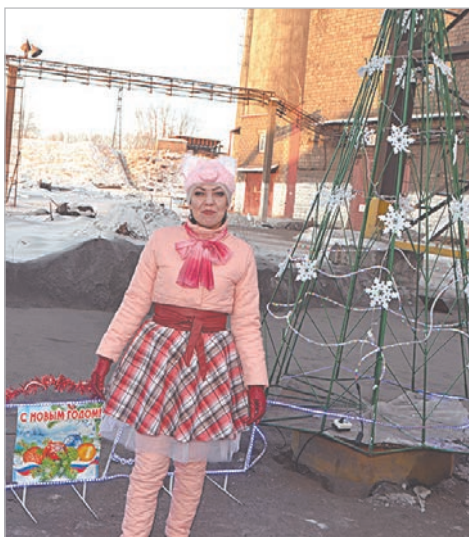
Перед агломерационным цехом всех встречает сверкающая огоньками елка.