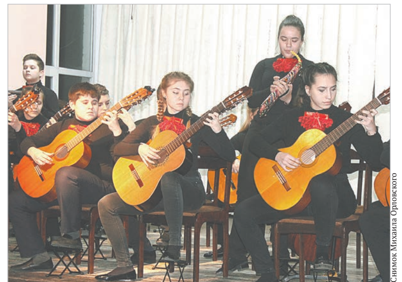
Бурными овациями зрители встречали выступления гитаристов.

Концерт «Рождественские встречи» собрал юных одаренных музыкантов, которые на протяжении всего 2018 года радовали своими успехами и достижениями. Трижды учащиеся удостоены звания абсолютных победителей с вручением диплома Гран-при. В копилке музыкантов 60 дипломов лауреатов конкурсов международного уровня, 45 – всероссийского, 10 – межрегионального и 40 – областного уровней. Творческие мероприятия 2018 года – тематические концерты, фестивали, конкурсы – собирали полный зал школы. В рамках концерта «Рождественские встречи» звучали не только звонкие голоса вокалистов, инструментальной музыки тоже было много. Бурными овациями зрители встреча-