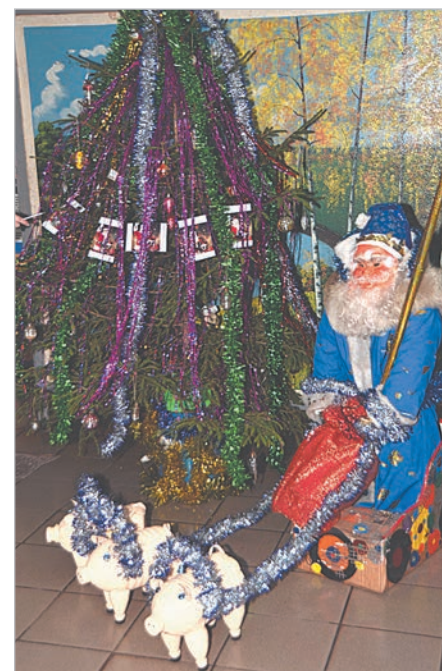
Елка в сортопрокатном цехе.