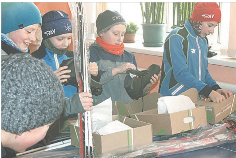
Юные лыжники по достоинству оценили новогодний подарок металлургов.