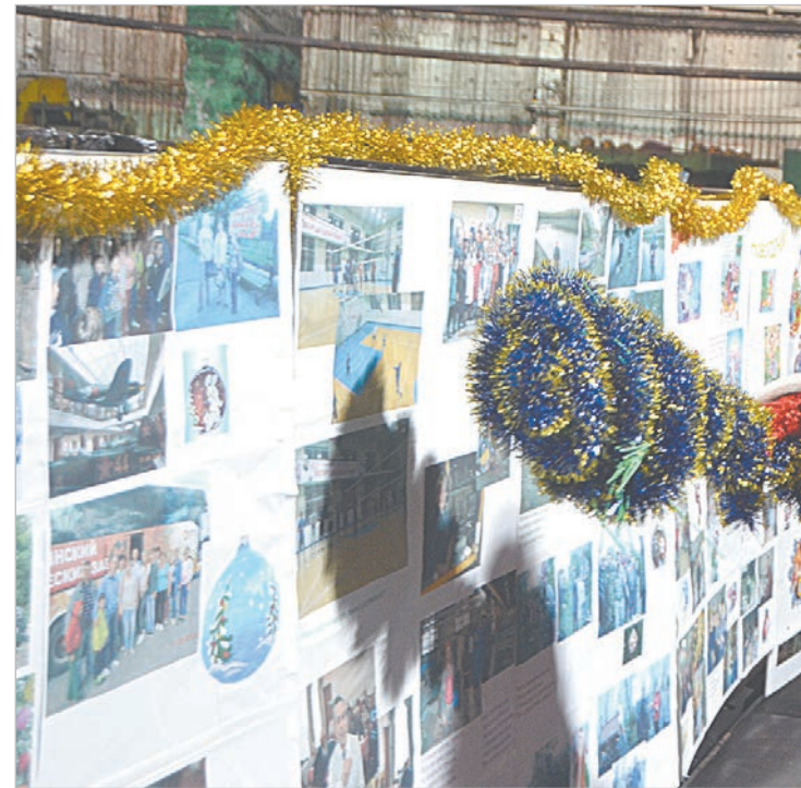
В калибровочном цехе успехов жюри в новом году пожелал сам Дед Мороз.