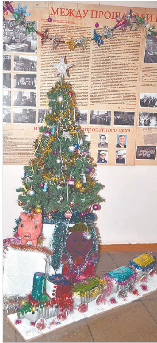
Новогодний уголок в сортопрокатном цехе.