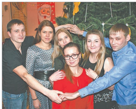
Команда сортпрокатчиков «Заводской десант» перед началом финального соревнования.