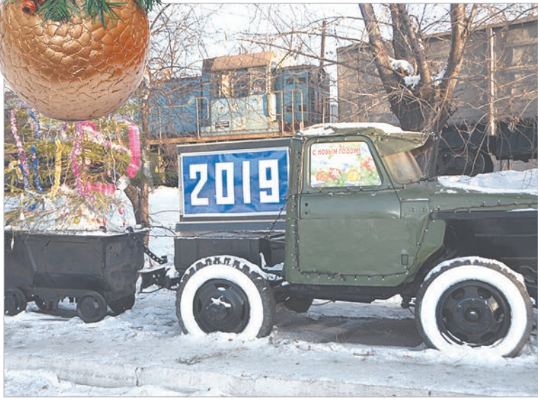
Долгие годы этот грузовик возил руду, а после – елку.