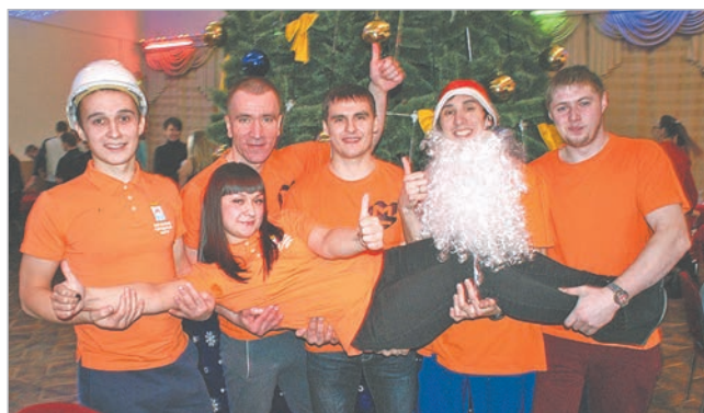
Команда крупносортного цеха «Смелые и целеустремленные».