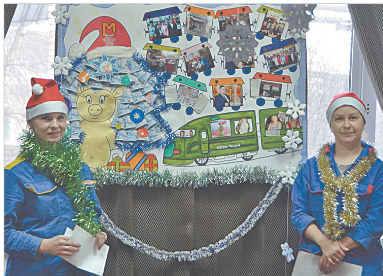
Экспресс калибровочного цеха мчится уже 85 лет!