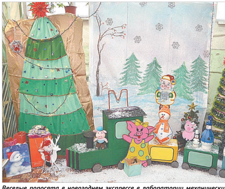
Веселые поросята в новогоднем экспрессе в лаборатории механических испытаний центральной аналитической лаборатории.