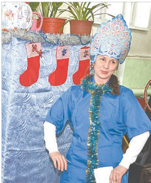
Снегурочка из ЦАЛ пожелала счастья и добра.

■ В 15-й раз умельцы Надеждинского металлургического завода интереснее, кто с наибольшей выдумкой украсит себя, коллег и особенно тех, кто нового