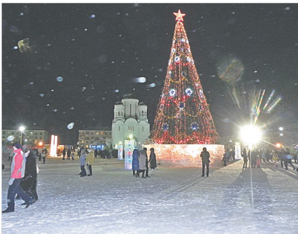
Новогодний городок расположился на Преображенской площади.

В связи с подготовкой и проведением праздничных мероприятий с 22:30 31 декабря 2018 года до 03:00 1 января 2019 года будет ограничено движение автотранспорта на следующих участках улиц (по периметру Преображенской площади): ул. Луначарского, от ул. Зеленой до ул. Заславского; ул. Зеленая, от ул. Ленина до ул. Луначарского; ул. Ленина, от ул. Зеленой до ул. Заславского; ул. Заславского, от ул. Ленина до ул. Луначарского.