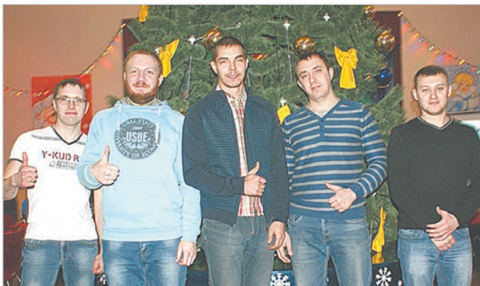
Команда энергоцеха «Энергия».

Финальное состязание состояло из трех туров. Первый – разминочный. Его целью было проявить сплоченность команды – узнать, на-