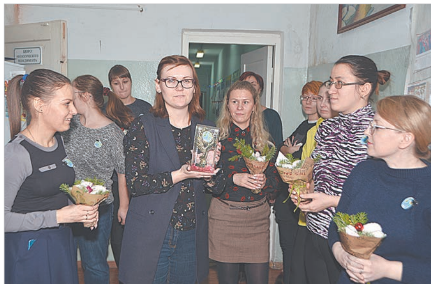
Коллектив службы экологического контроля пригласил жюри в «вагон-ресторан».