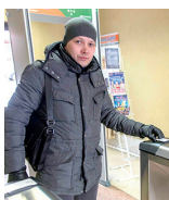
Одеваемся по погоде

Самым эффективным способом убедить себя от осложнений после ОРВИ и гриппа – это вакцинопрофилактика. Планируйте и ставьте прививку с ранней осени, тогда к сезону заболеваний ваш организм будет достаточно защищен.