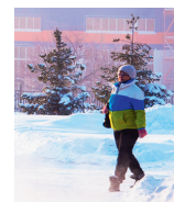
На работу – пешком