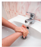
Моем руки чаще