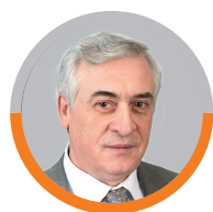
ЯКОВ СИЛИН, ректор Уральского государственного экономического университета

Продолжаем беседу, начатую в номере от 1 февраля 2019 года. Сегодня речь пойдет о тех, кто еще только планирует переступить порог заводской проходной.