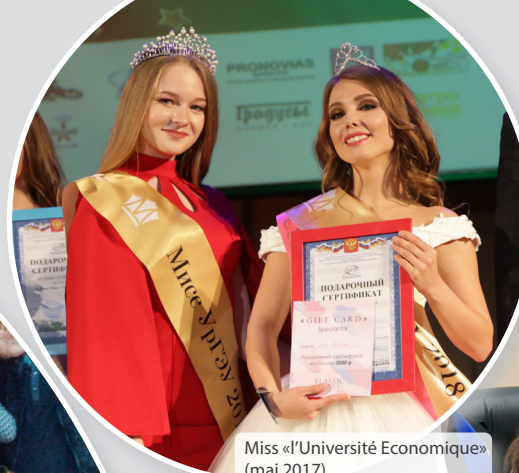
Miss «l'Université Economique» (mai 2017)