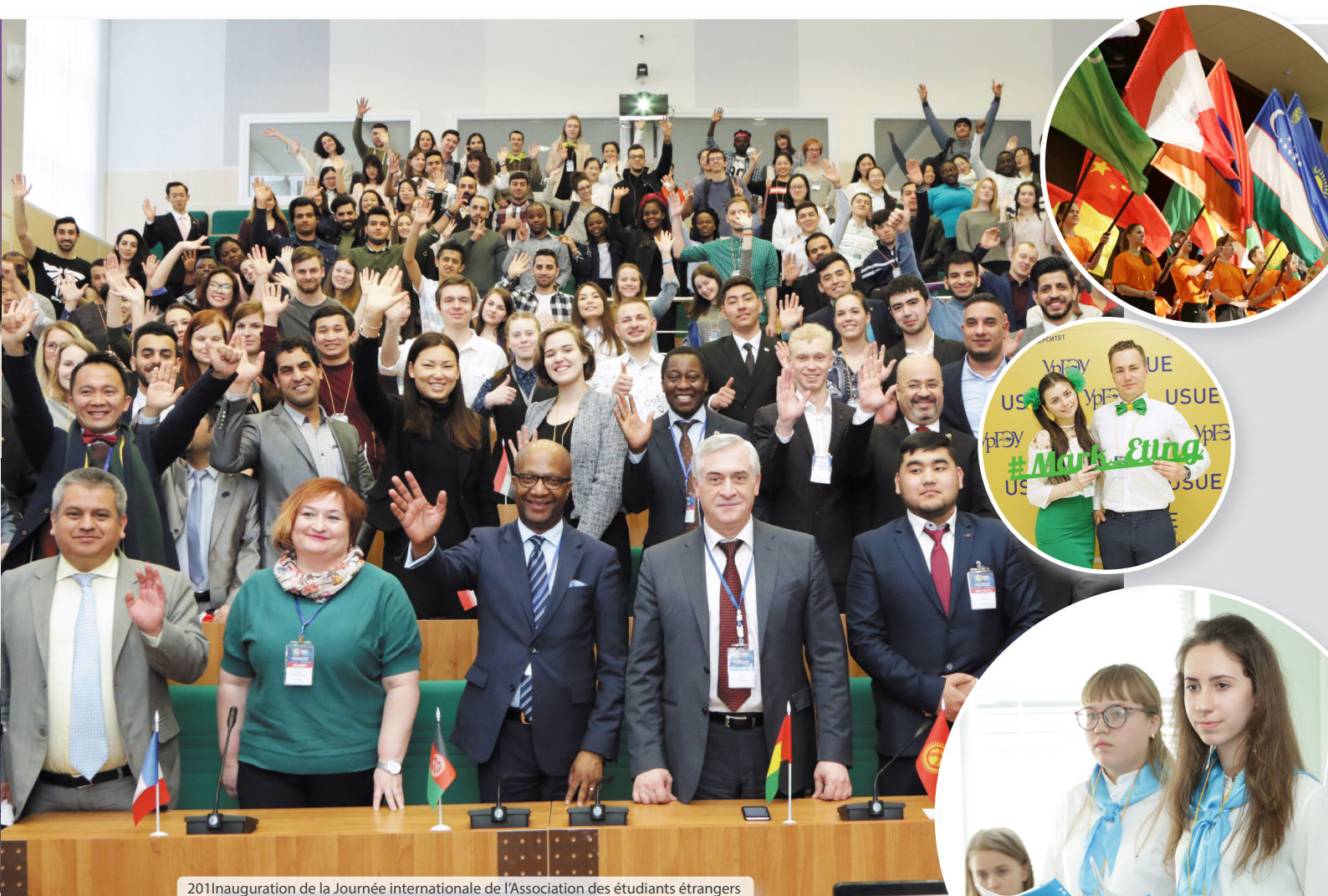
2011 Inauguration de la Journée internationale de l'Association des étudiants étrangers