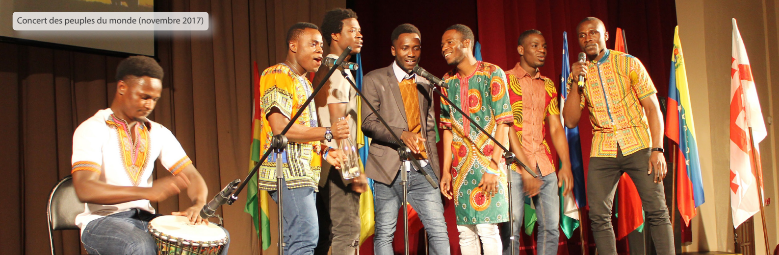
Concert des peuples du monde (novembre 2017)