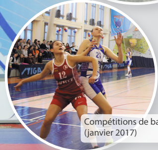
Compétitions de basket-ball (janvier 2017)