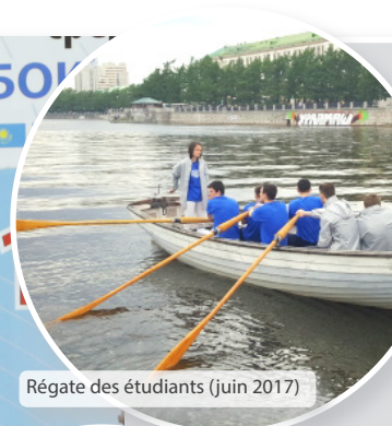
Régate des étudiants (juin 2017)