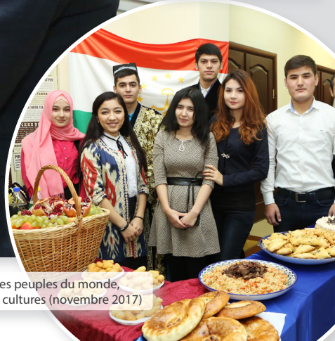
L'Exposition des peuples du monde, le Festival des cultures (novembre 2017)