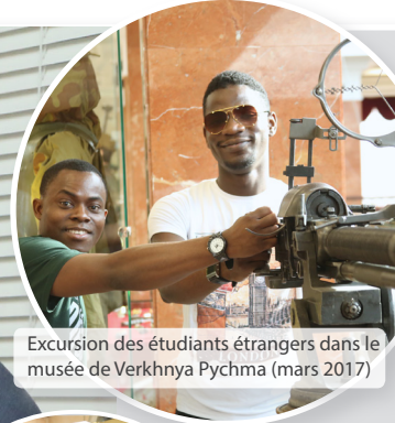
Excursion des étudiants étrangers dans le musée de Verkhnaya Pychma (mars 2017)