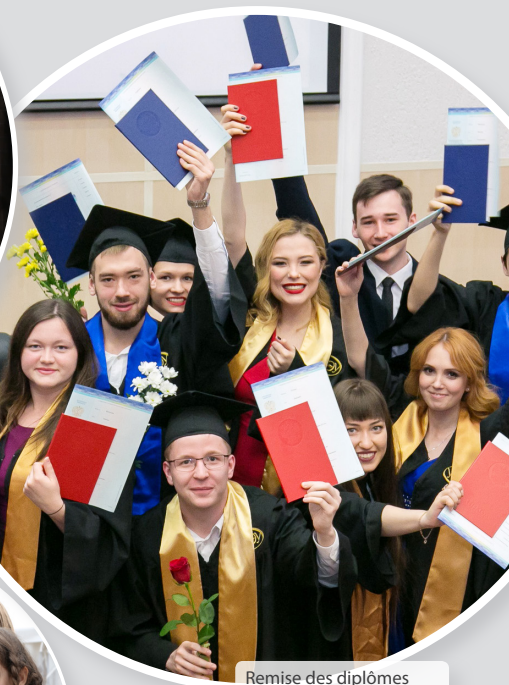
Remise des diplômes (juillet 2017)