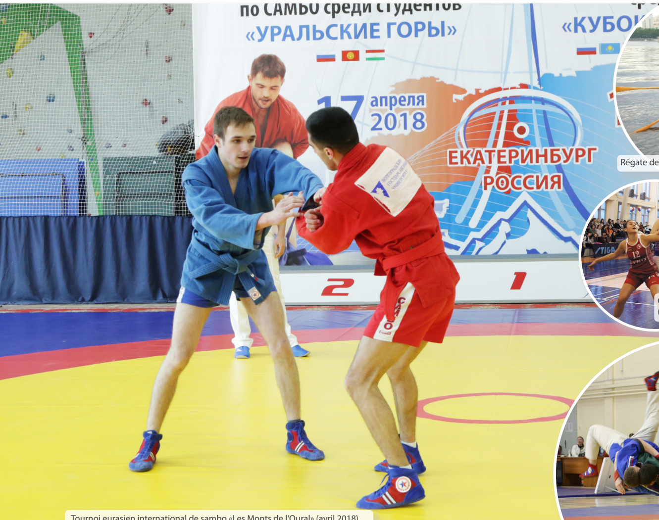
Tournoi eurasien international de sambo «Les Monts de l'Oural» (avril 2018)