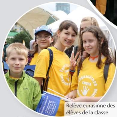
Relève eurasienne des élèves de la classe supérieur (juillet 2017)