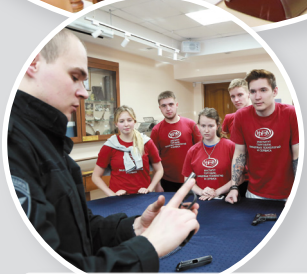
Le jour de ДОСААФ (société des bénévoles aidant l'armée, la marine et l'aviation) (février 2018)