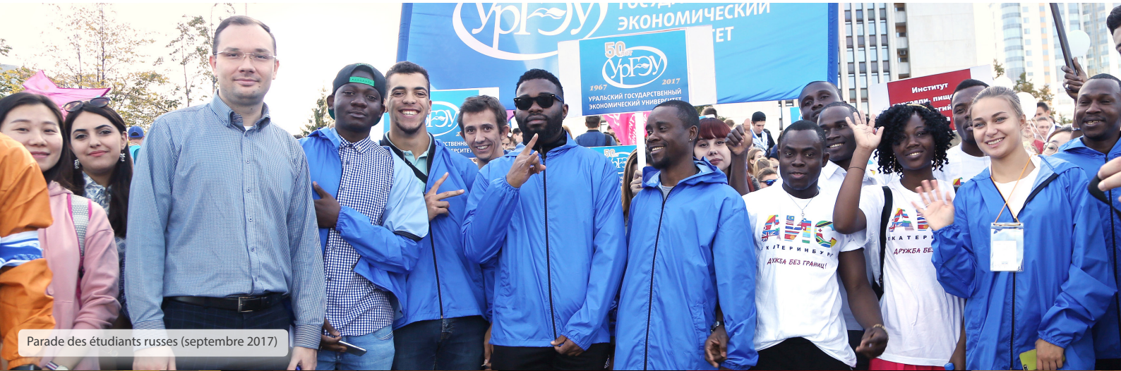
Parade des étudiants russes (septembre 2017)