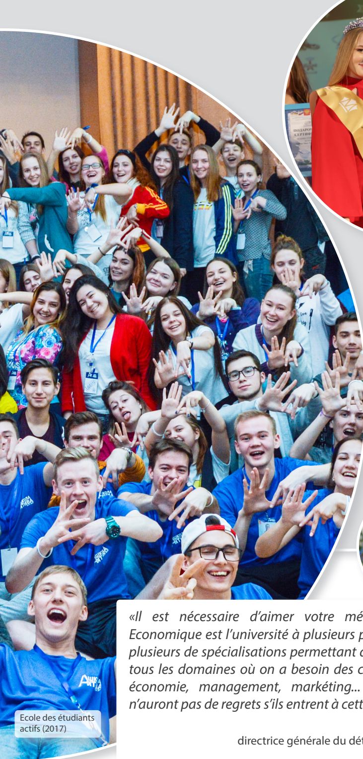
Ecole des étudiants actifs (2017)