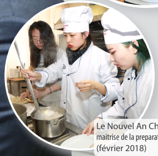
Le Nouvel An Chinois (cours de maîtrise de la préparation des raviolis) (février 2018)