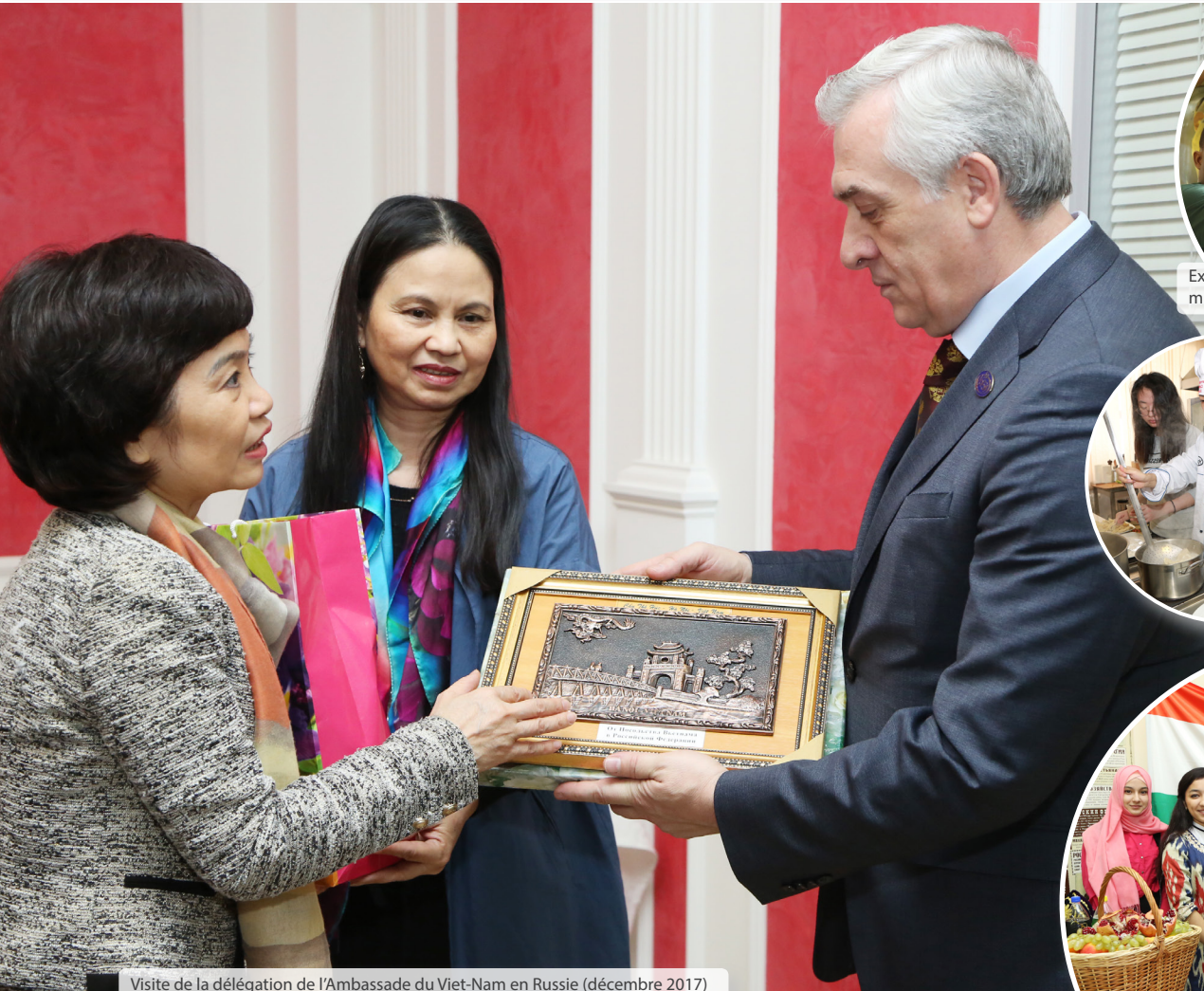
Visite de la délégation de l'Ambassade du Viet-Nam en Russie (décembre 2017)