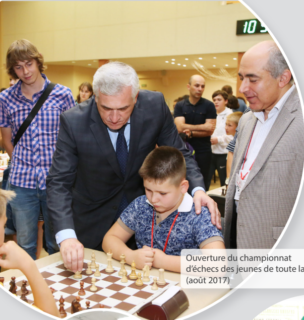
Ouverture du championnat d'échecs des jeunes de toute la Russie (août 2017)