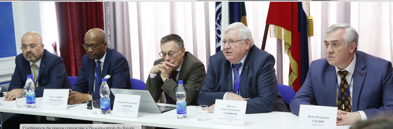
Conférence de presse consacrée à l'inauguration du forum