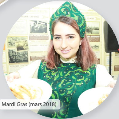
Mardi Gras (mars 2018)