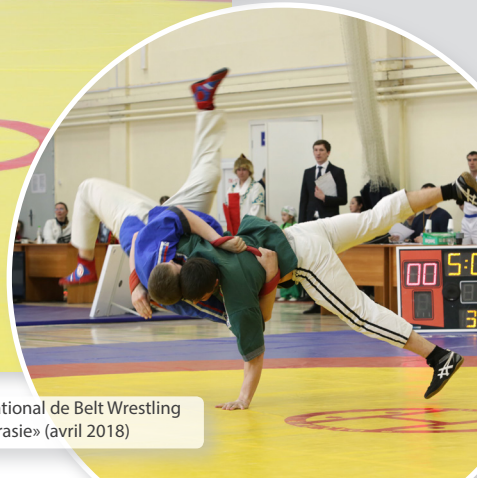
Tournoi International de Belt Wrestling «Coupe de l'Eurasie» (avril 2018)